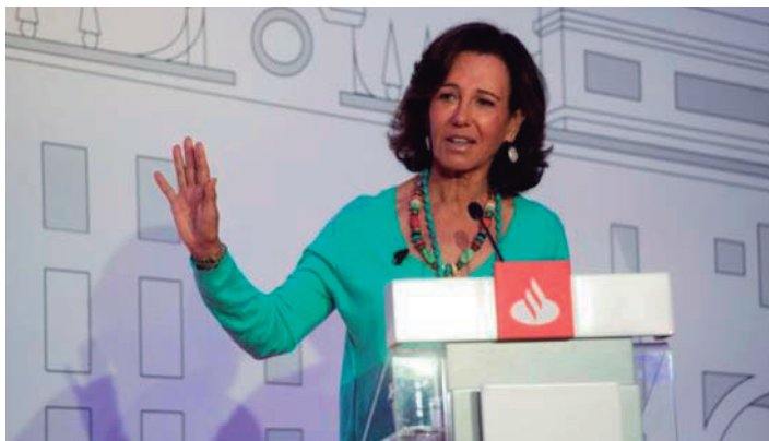
La presidenta del Banco Santander, Ana Botín, ha anunciado este viernes el proyecto urbanístico